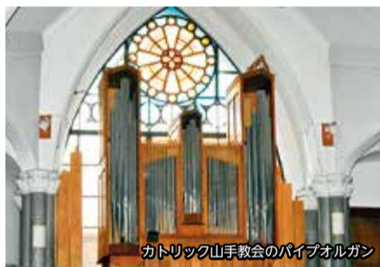
カトリック山手教会のパイプオルガン

☎682-2000 ☎682-2023 パイプオルガンと横浜の街 各先着。費用等詳細は8月16日からHPで。 ①オープニング・レクチャー。西川オルガンのデモ演奏も ②パイプオルガン巡りと聴き比べ ☎①10月1日(金)14時～15時30分 ②10月9日(土)～31日(日) ☎①開港記念会館②市内の教会ほか ☎9月1日11時から☎かHPで